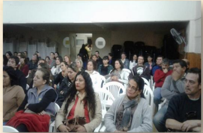
ENCUENTRO DE PADRES DE 1º Y 2º AÑO, A CARGO DEL EQUIPO DE TUTORÍA, PSICÓLOGA Y PRECEPTORÍA DEL COLEGIO, ACOMPAÑADOS POR EL EQUIPO DIRECTIVO Y DOCENTES. EL OBJETIVO DEL ENCUENTRO ES COMPARTIR INQUIETUDES, TEMORES, ALEGRÍAS Y EXPECTATIVAS SOBRE LA ADOLESCENCIA, ETAPA EN LA QUE SE ENCUENTRAN SUS HIJOS.