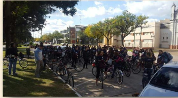
“BICICLETADA POR LA REALIDAD”, ALUMNOS DE QUINTOS AÑOS ACOMPAÑADOS POR CATEQUISTAS, DOCENTES, DIRECTOR Y PORTERO, RECORRIERON LAS BARRIOS DE LA CIUDAD.